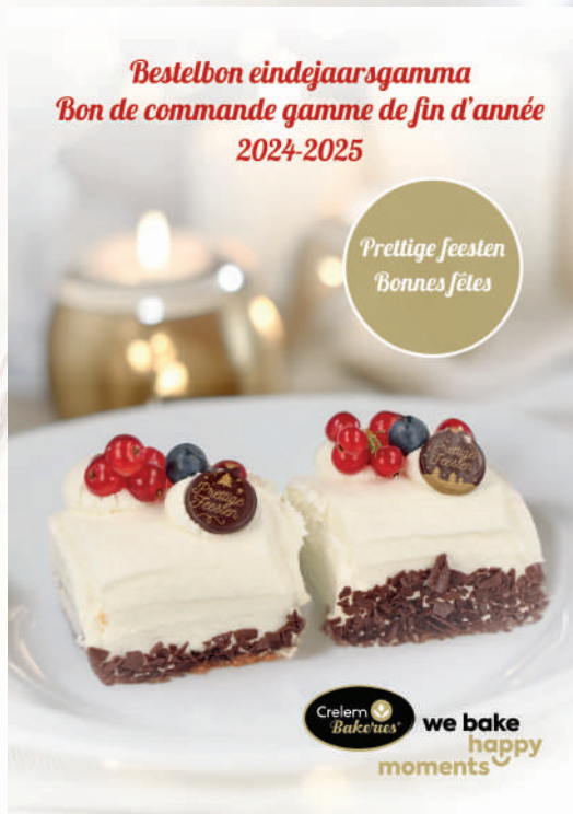
Bestelbon / Bon de commande

Boostez votre chiffre d'affaires avec notre matériel promotionnel.